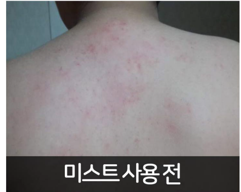
미스트 사용 전