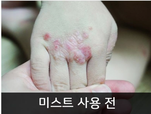
미스트 사용 전