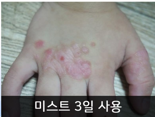
미스트 3일 사용