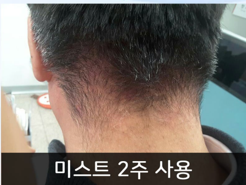
미스트 2주 사용