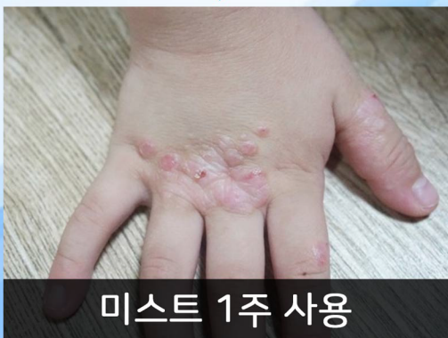
미스트 1주 사용