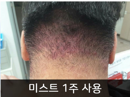
미스트 1주 사용