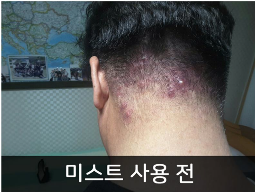
미스트 사용 전